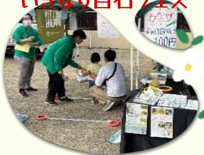
いざなり白石フェス