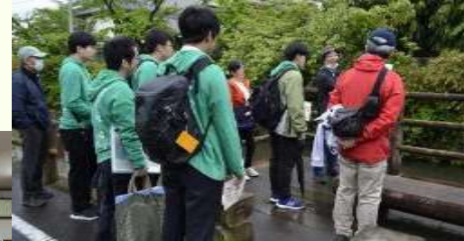
白石市城北コミュニティ・ 街歩きガイド研修会