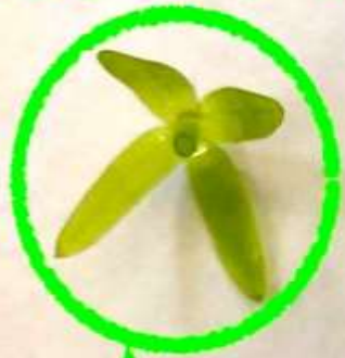
アナカリス (オオカナダモ)