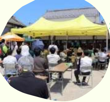
白石百白 梅花藻祭り