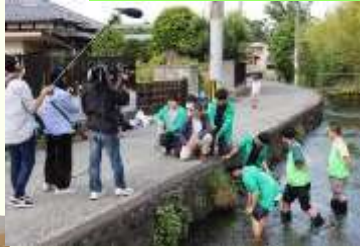
テレビラジオでの広報