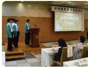
商工会議所女性会