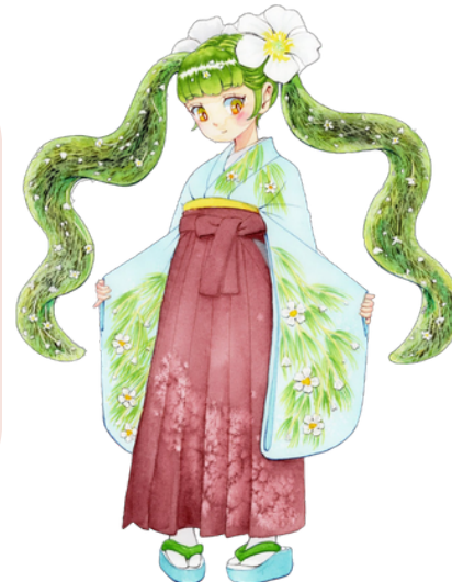
白石梅花藻姫 絵師：うりゃん！さん