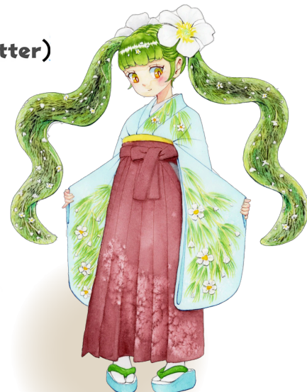
白石梅花藻姫 絵師：うりゃん!さん